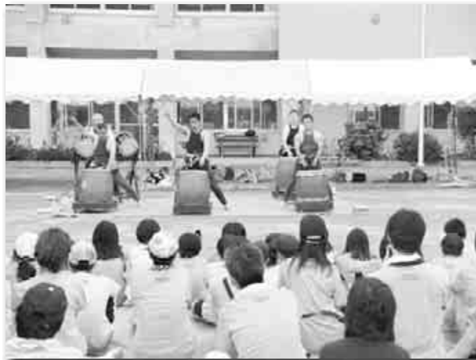
地元につながる湯かけ太鼓の演奏

夕食は保護者の方々にご協力をいただいて、「バーベキュー」。夕食後にキャンプファイヤーを行いました。