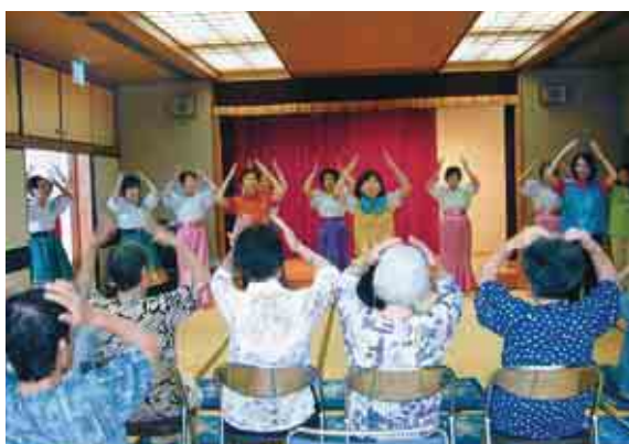
手話ダンスの慰問