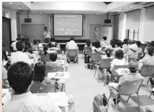
ハッ場ダム広報センターで説明を受ける水の大使たち

陰には水没地の方々の大変なご苦労・ご理解があるということ、また、『水の貴重さ・大切さ』を実感していただけたのではないかと思います。