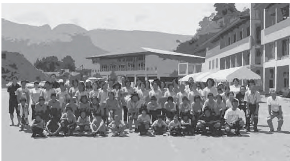
長野原町立第一小学校