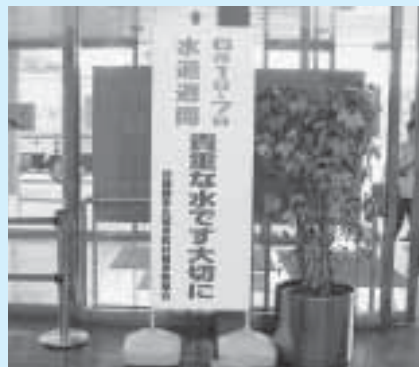
成田市役所ロビー