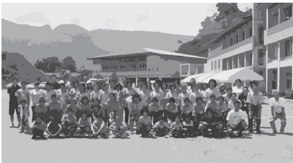
長野原町立第一小学校