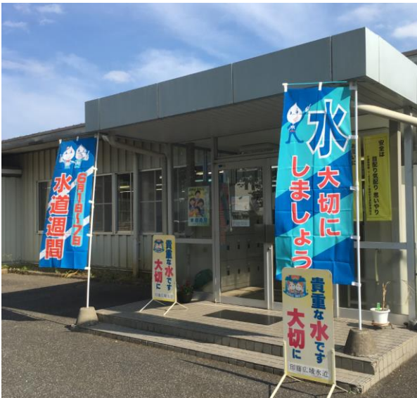
長門川水道企業団 上前浄水場フェンス

長門川水道企業団上前浄水場の敷地に横断幕を設置し、訪れる方に水の大切さを呼びかけました。